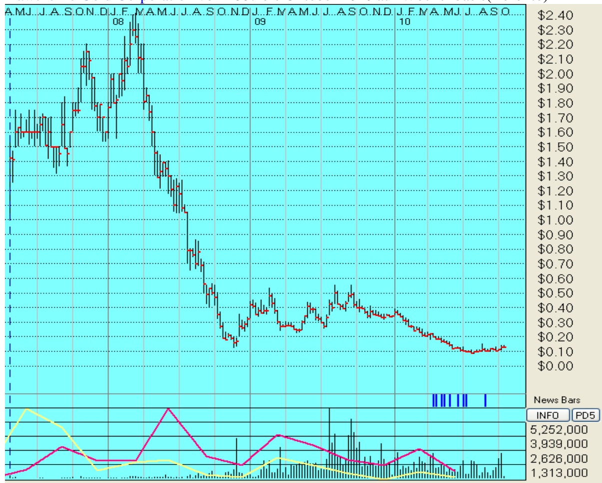
Hawthorne Gold Corporation von 2007 bis Oktober 2010 auf Wochenbasis(Toronto)

Meine persönliche Einschätzung: ein relativ risikoloser Kauf bei gutem Gewinnpotential